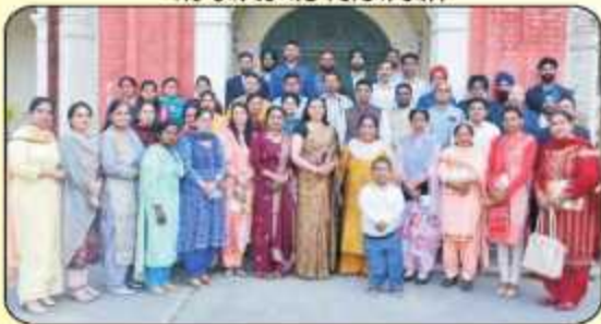
ਕਾਲਜ ਵਿੱਚ ਪੁਰਾਣੇ ਵਿਦਿਆਰਥੀਆਂ ਦੇ ਮਿਲਣੀ ਸਮਾਰੋਹ ਦੌਰਾਨ ਕਾਲਜ ਦੇ ਪੁਰਾਣੇ ਵਿਦਿਆਰਥੀ ਅਤੇ ਸਟਾਫ ਮੈਂਬਰ।