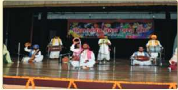
ਗੁਰੂ ਨਾਨਕ ਦੇਵ ਯੂਨੀਵਰਸਿਟੀ ਵਲੋਂ ਕਰਵਾਏ ਗਏ ਜੋਨਲ ਯੁਵਕ ਮੇਲੇ ਵਿੱਚ Folk Orchestra ਵਿੱਚ ਪਹਿਲਾ ਸਥਾਨ ਪ੍ਰਾਪਤ ਕਰਨ ਵਾਲੀ ਕਾਲਜ ਟੀਮ।