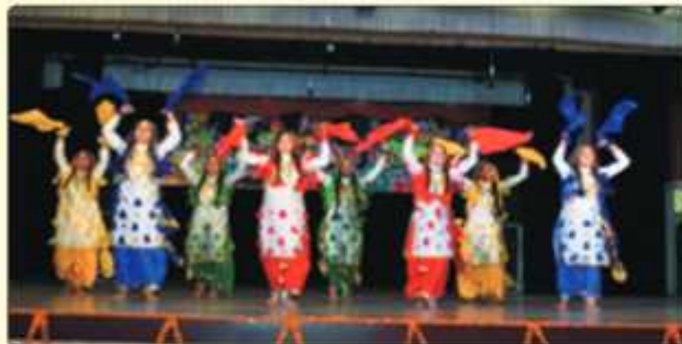
ਗੁਰੂ ਨਾਨਕ ਦੇਵ ਯੂਨੀਵਰਸਿਟੀ ਵਲੋਂ ਕਰਵਾਏ ਗਏ ਜੋਨਲ ਯੁਵਕ ਮੇਲੇ ਵਿੱਚ Luddi ਵਿੱਚ ਤੀਜਾ ਸਥਾਨ ਪ੍ਰਾਪਤ ਕਰਨ ਵਾਲੀ ਕਾਲਜ ਟੀਮ।