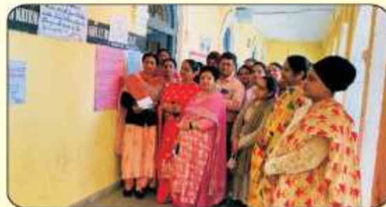
ਕਾਲਜ ਵਿੱਚ ਔਤਰ-ਰਾਬਟਰੀ ਮਹਿਲਾ ਦਿਵਸ ਮਨਾਉਂਦੇ ਹੋਏ ਕਾਲਜ ਦੇ ਸਟਾਫ ਮੈਂਬਰ।