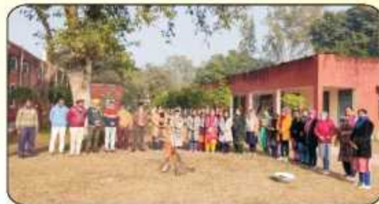
ਕਾਲਜ ਵਿੱਚ ਲੋਹੜੀ ਦਾ ਤਿਉਹਾਰ ਮਨਾਉਂਦੇ ਹੋਏ ਕਾਲਜ ਦੇ ਸਟਾਫ ਮੈਂਬਰ।