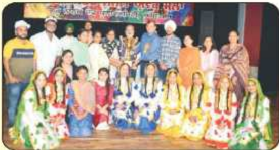
ਗੁਰੂ ਨਾਨਕ ਦੇਵ ਯੂਨੀਵਰਸਿਟੀ ਵੱਲੋਂ ਕਰਵਾਏ ਗਏ ਜੈਨਲ ਯੂਵਕ ਮੇਲੇ ਵਿੱਚ ਪਹਿਲਾ ਸਥਾਨ ਪ੍ਰਾਪਤ ਕਰਨ ਮੌਕੇ ਟਰਾਫੀ ਲੈਂਦੇ ਹੋਏ ਕਾਲਜ ਦੇ ਸਟਾਫ ਮੈਂਬਰ ਅਤੇ ਵਿਦਿਆਰਥੀ।