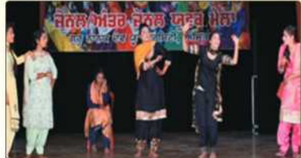
ਗੁਰੂ ਨਾਨਕ ਦੇਵ ਯੂਨੀਵਰਸਿਟੀ ਵਲੋਂ ਕਰਵਾਏ ਗਏ ਜੋਨਲ ਯੁਵਕ ਮੇਲੇ ਵਿੱਚ Skit ਵਿੱਚ ਦੂਜਾ ਸਥਾਨ ਪ੍ਰਾਪਤ ਕਰਨ ਵਾਲੀ ਕਾਲਜ ਟੀਮ।