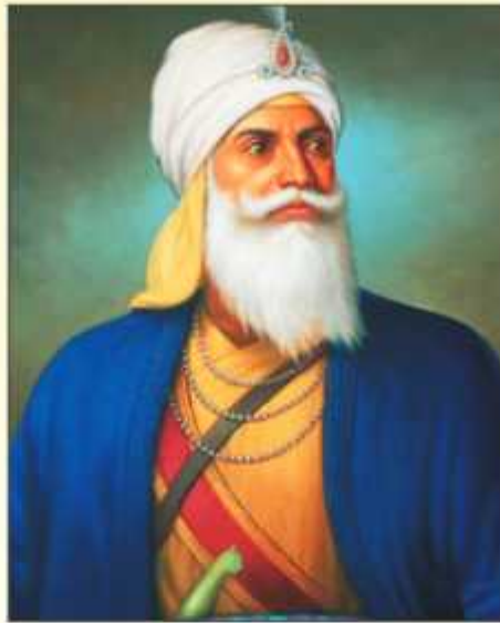
ਨਵਾਬ ਜੱਸਾ ਸਿੰਘ ਆਹਲੂਵਾਲੀਆ