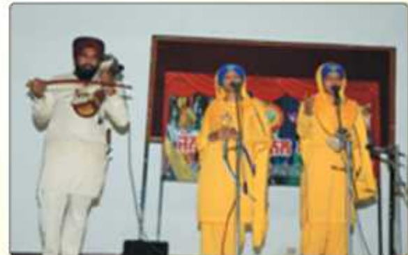
ਗੁਰੂ ਨਾਨਕ ਦੇਵ ਯੂਨੀਵਰਸਿਟੀ ਵਲੋਂ ਕਰਵਾਏ ਗਏ ਜੋਨਲ ਯੁਵਕ ਮੇਲੇ ਵਿੱਚ Vaar ਵਿੱਚ ਤੀਜਾ ਸਥਾਨ ਪ੍ਰਾਪਤ ਕਰਨ ਵਾਲੀ ਕਾਲਜ ਟੀਮ।