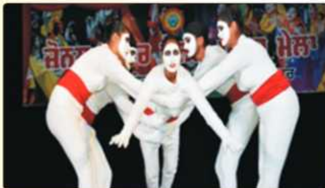
ਗੁਰੂ ਨਾਨਕ ਦੇਵ ਯੂਨੀਵਰਸਿਟੀ ਵਲੋਂ ਕਰਵਾਏ ਗਏ ਜੋਨਲ ਯੁਵਕ ਮੇਲੇ ਵਿੱਚ Mime ਵਿੱਚ ਦੂਜਾ ਸਥਾਨ ਪ੍ਰਾਪਤ ਕਰਨ ਵਾਲੀ ਕਾਲਜ ਟੀਮ।